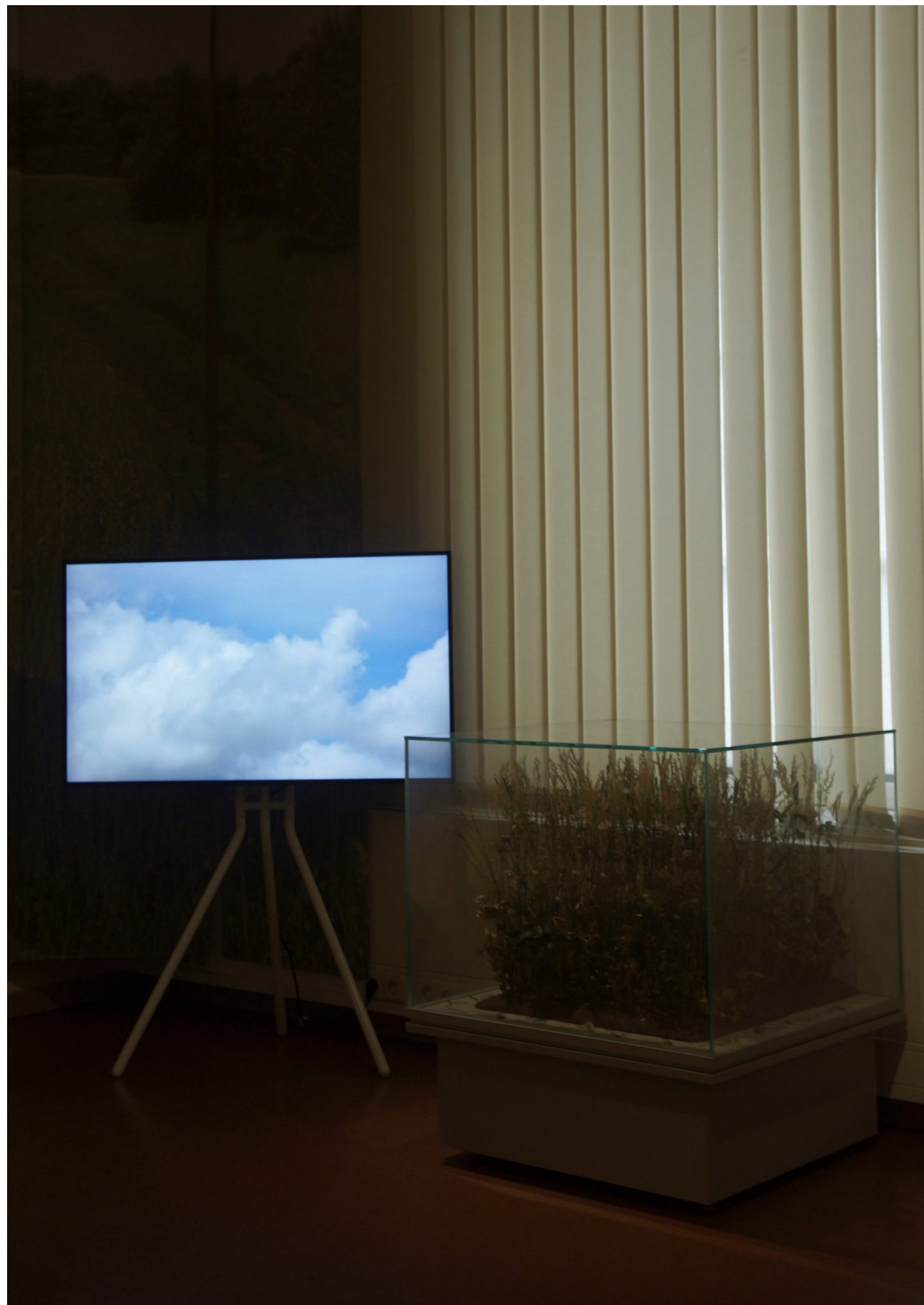
Common Ground 2021, Ausstellungsansicht, Senckenberg Museum für Naturkunde