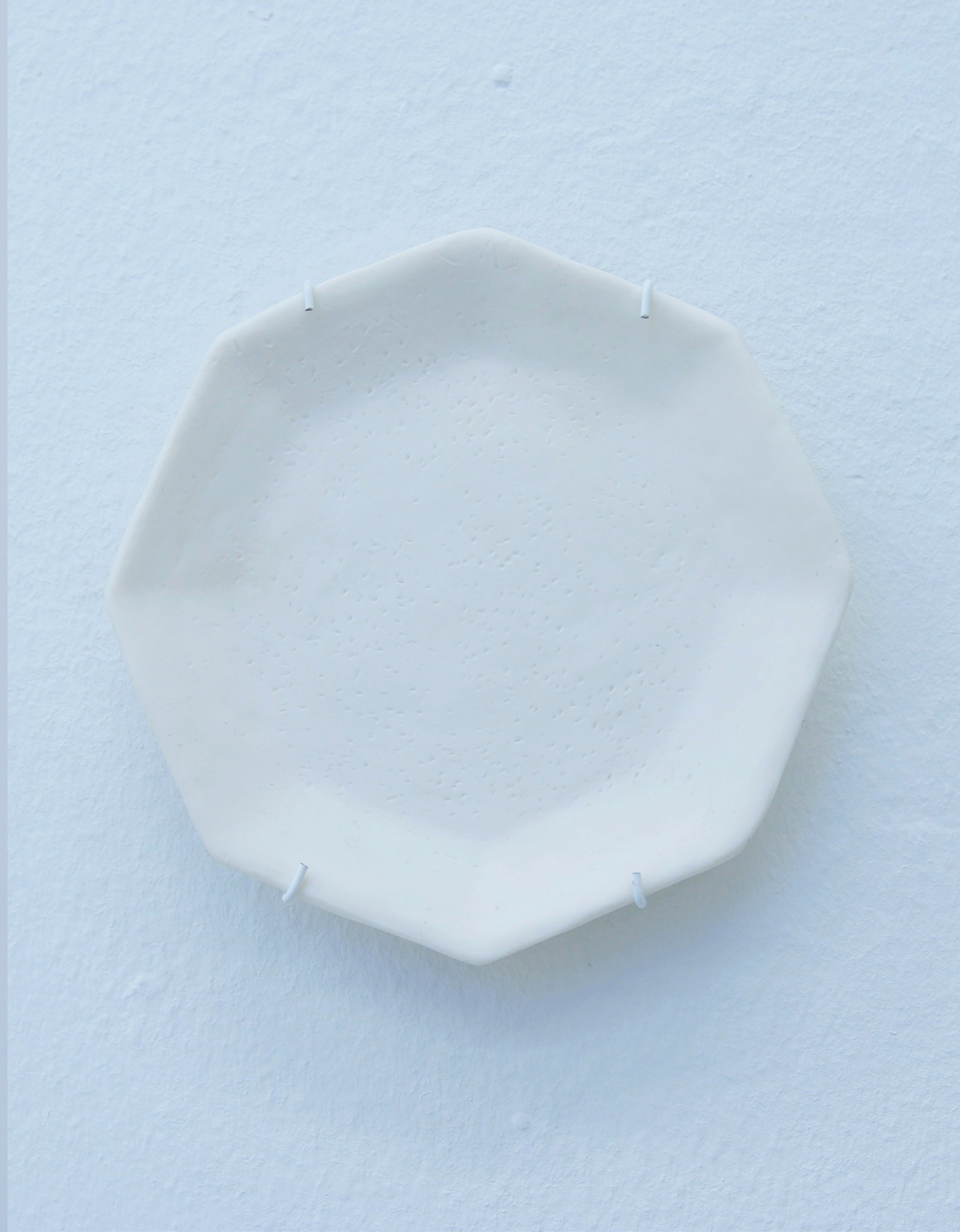
Taubenteller I-IV 2021, Ø ca. 13-28 cm, unglasiertes Porzellan mit Taubendekor