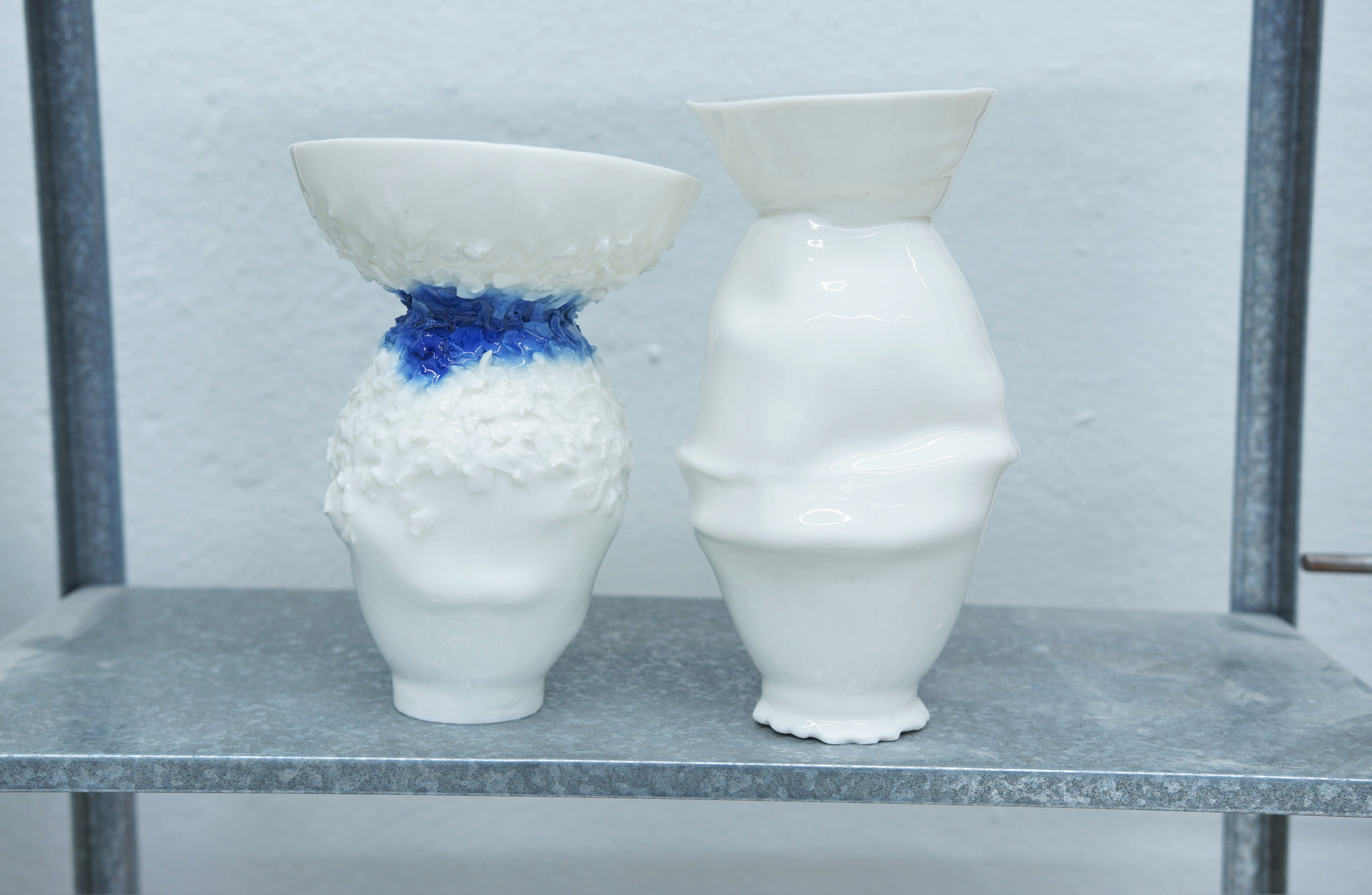
Porzellanvasen I+II 2021, Porzellan glasiert, ca. 18x18x35 cm