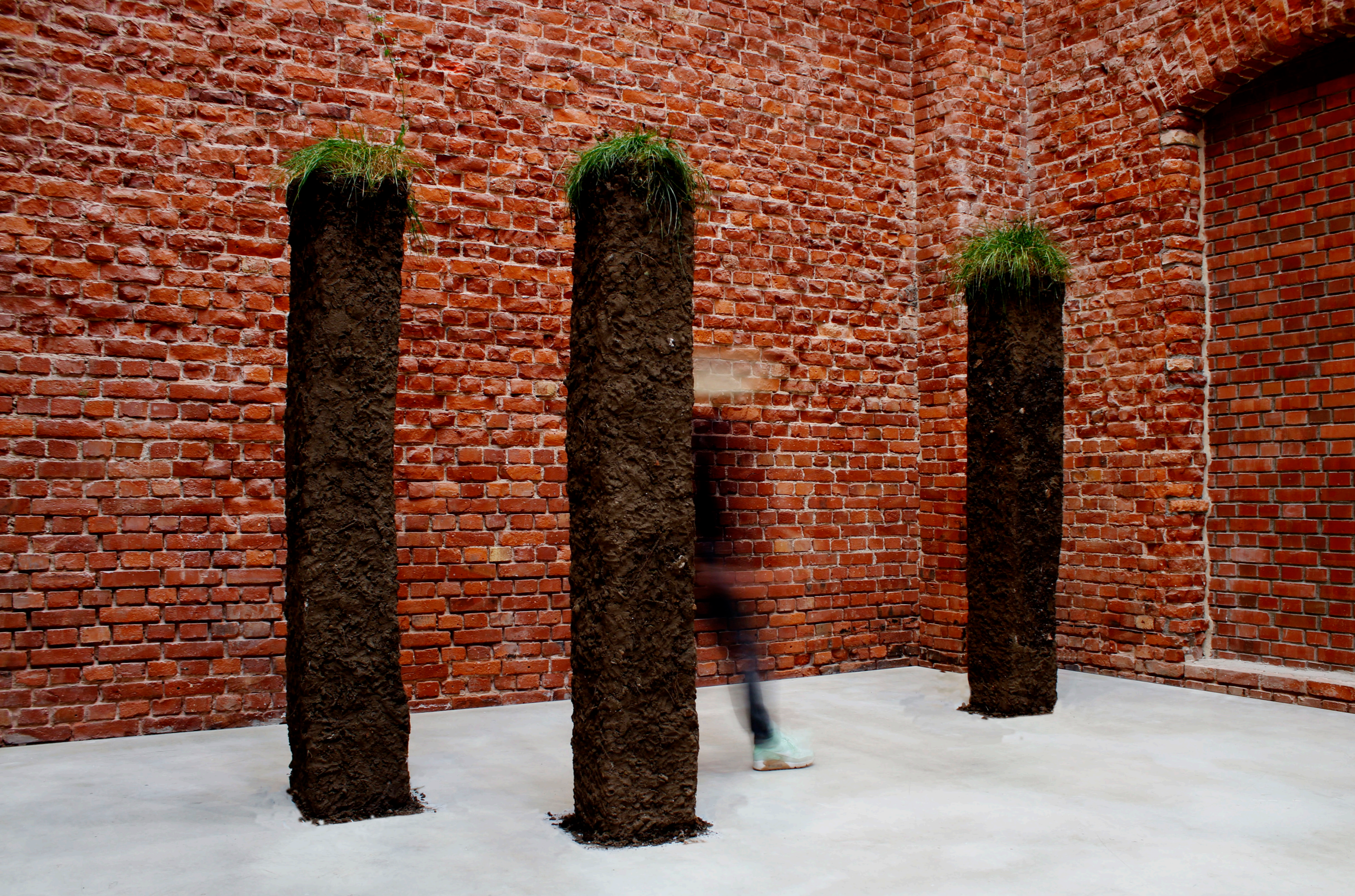
Wiesenstücke 2020, ca. 40x40x220 cm, diverse Materialien