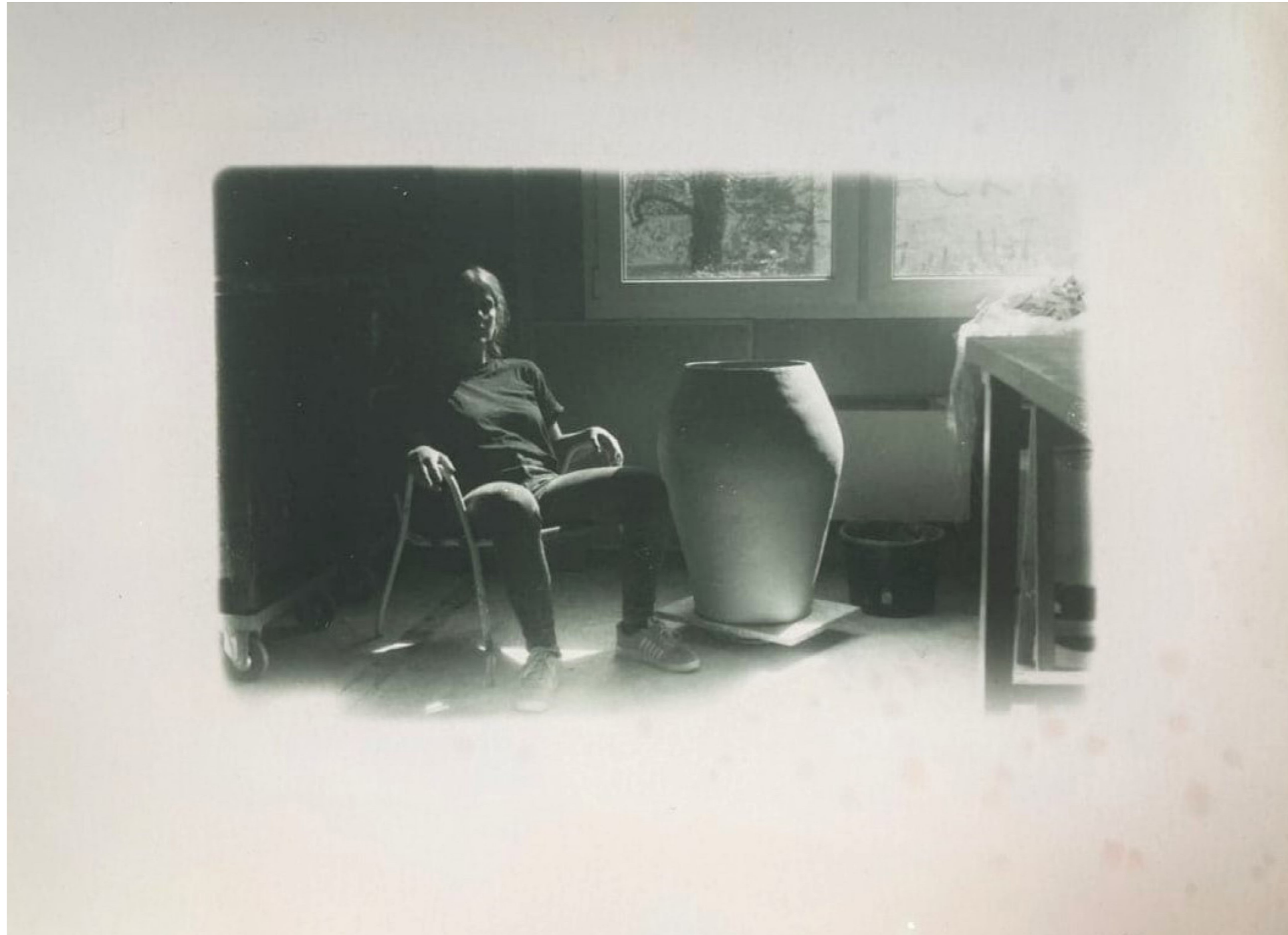
Ich und meine Arbeit 2020, unfixierte Analogfotografie, Baryt, ca. 210x290 cm

Eine Foto zeigt mich sitzend neben einer meiner ersten großen Keramiken. Beim analogen Entwicklungsverfahren wurde ein zentraler Schritt weggelassen: das Fixieren. Je häufiger man sich das Bild ankuckt, und je stärker die Lichtquelle dabei, desto mehr verschwindet das Motiv.