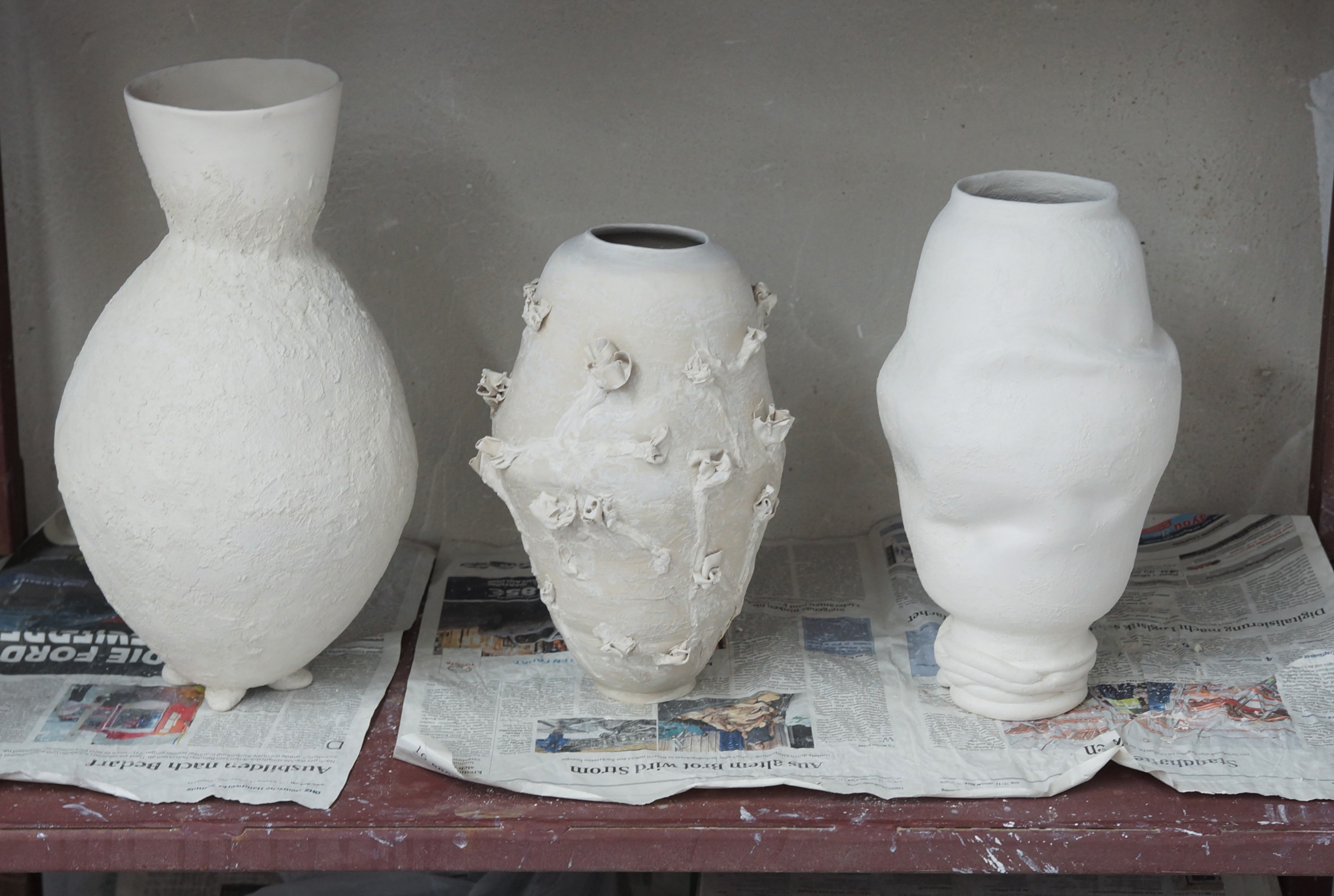
Porzellanvasen III-V 2022, Atelieransicht, Porzellan ungebrannt