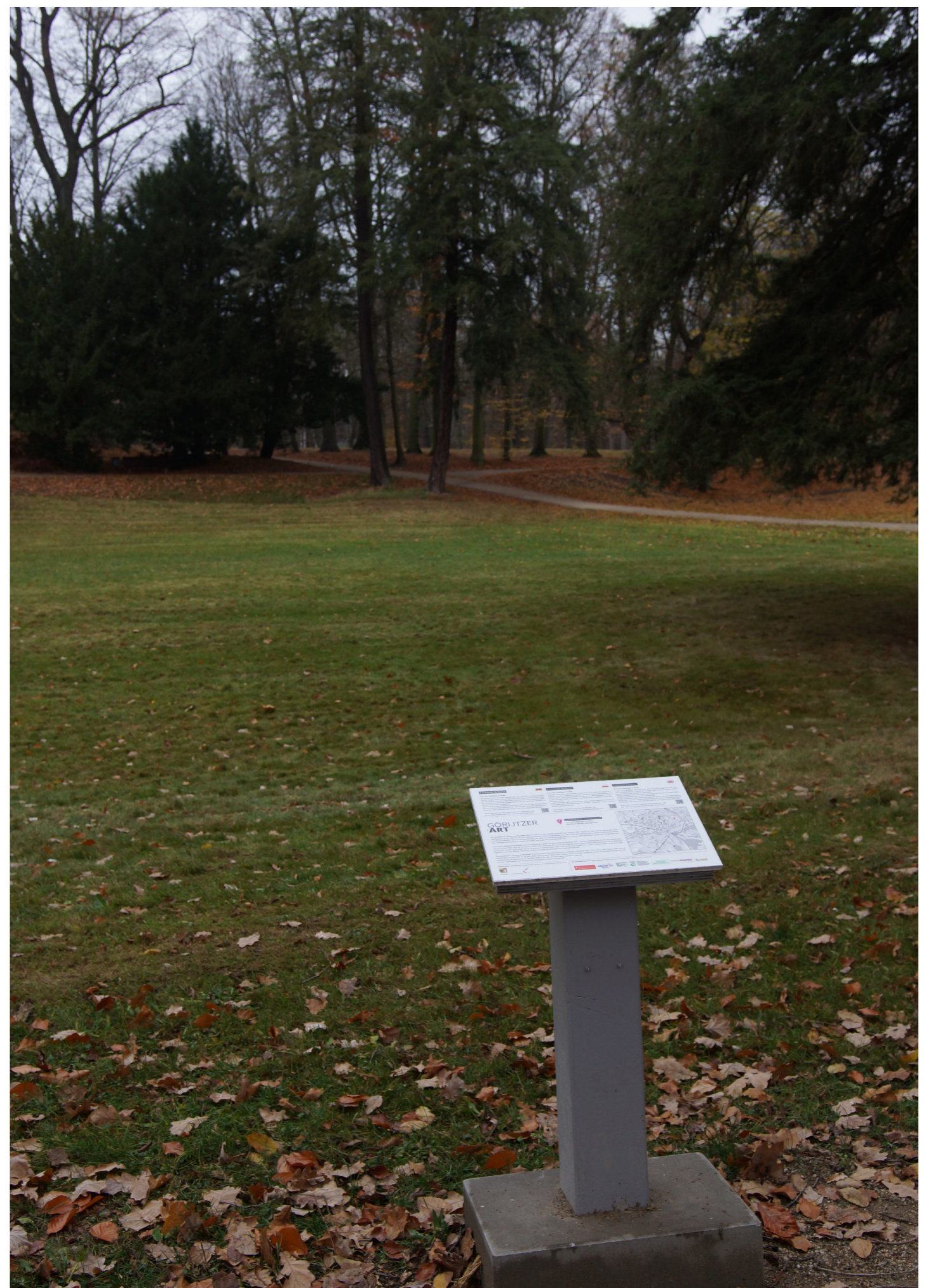
Ort des Bodenaustauschs auf deutscher Seite, Stadtpark Görlitz